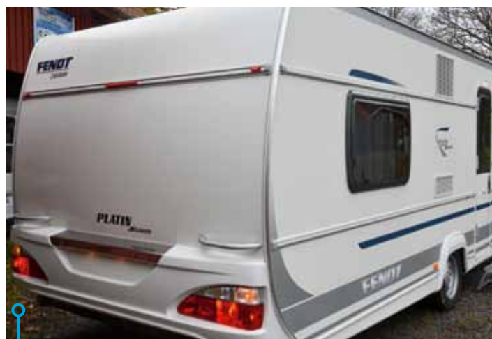
Bland annat lyktorna skiljer Fendt från Hobby, koncernsyster.