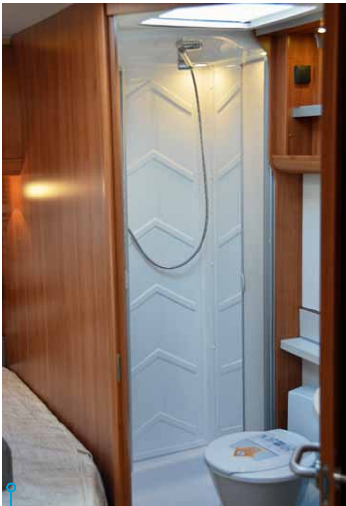
Förföriskt fräscht. Vem behöver utnyttja campingens dusch med ett sådant tvättrum till förfogande?

slitsar i botten för att effektivare torka ur eventuell fukt ur kläderna och för att ta vara på värmen från pannan som sitter under garderoben.