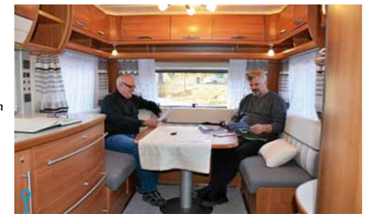
Välväxta män i sina bästa år trivs förträffligt väl i sittgruppen.