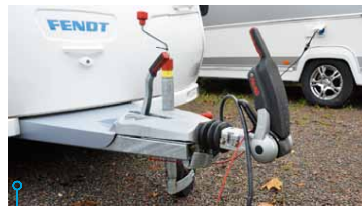
Nytt friktionsdrag från Alko och kultrycksvåg i stödhjulet.

HUR KAN DET KOMMA SIG undrar vän av ordning? Jo, Fendt har helt enkelt lyssnat på de svenske (importör och återförsäljare) och byggt en vagn man tidigare inte har haft i sin modellflora. Scand i namnet står för Scandinavia och visar att vagnen är byggd just för oss här uppe i kalla nord. Den har begåvats med sådant som vi kräsa svenskar anser nödvändigt för att kunna campa året runt, till exempel en invändigt monterad avloppstank och en garderob