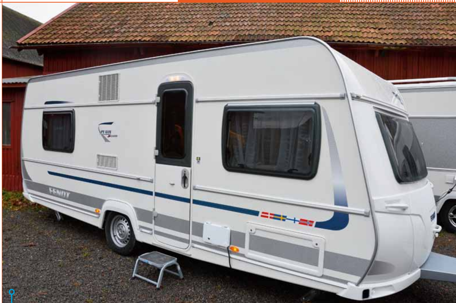
Flaggorna på sidan av vagnen skvallrar om att detta är en Scandversion. Vinteranpassad med utdragbar skidhållare innanför luckan.