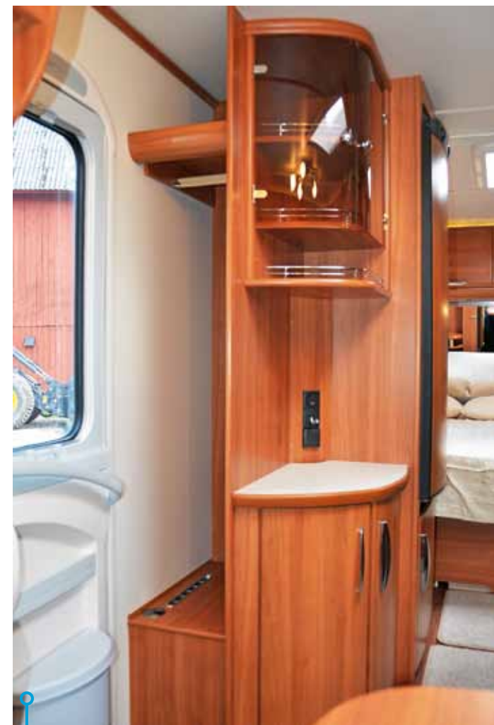
En hallmöbel anpassad för den nordiska marknaden. Precis som vi vill ha det. Plats för kläder och skor innanför ytterdörren.

med uppvärmt skofack direkt vid entrédörren, för att nämna något. Dessa anpassningar har gett vagnen en egen planlösning som man inte hittar i någon annan modellserie från Fendt. Det betyder att man går in vid den framtill monterade u-sittgruppen, att man har kök mitt i vagnen och att den franska sängen finns i vagnens högra bakre hörn. Mitt emot den hittar vi dubbelgarderoben och ett rymligt tvättrum med separat duschkabin.