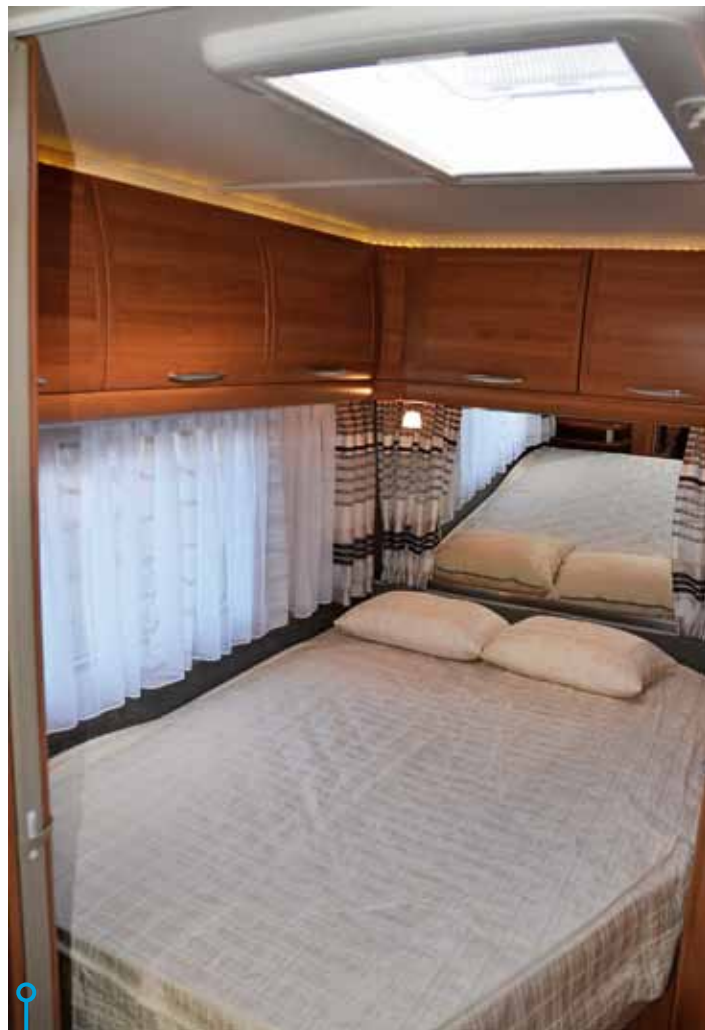
Förvånande fritt från finesser. Vi saknar både hyllor och eluttag, men sängen är skön och lätt att ta sig i och ur.

Vagnen har vattenburen värme från Alde och den kan säkert klara en sträng vinterkyla. En fläck på vinterromdömet är frånvaron av riktiga luftspalter i överskåpen. Det hittar vi bara i ett av dem men uppvärmd garderob direkt vid entrédörren, kultrycksvåg, frostsäkert monterad avloppstank och en elegant design gör vagnen riktigt begärlig. Mer info: www.fendt-caravan.se