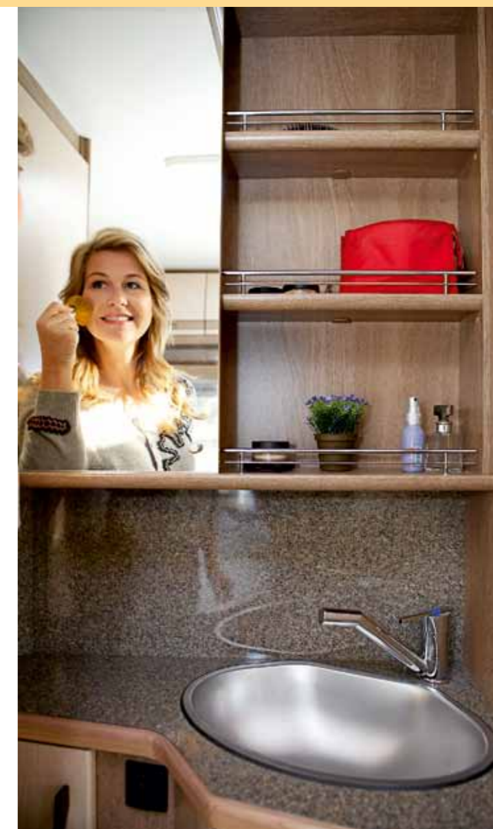
DAMHÖRNA. Det separerade handfatsutrymme är en dröm för alla som värdesätter ett mysigt sminkhörn.