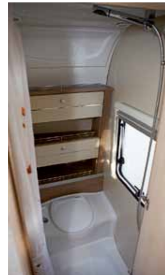
INTIMT. Trots litenheten känns toalettutrymme funktionellt.