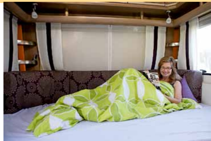
SOFFLIGGARE. När sittgruppen förvandlats till säng får både hon och en eventuell han plats.

PÅ SIDAN av garderoben finns en öppen hylllösning samt ett skåp mot entrédörren. Här tycker Fendts marknadsförare i sina broschyrer att man ska ha kaffebryggaren. Vi provar och jag tycker att det känns knasigt. Kaffet vill jag brygga i köket, punkt slut. Tyvärr finns heller ingen klädstång eller förvaring för skor i entrén, skåpet är inte tillräckligt djupt för att rymma annat än barnskor.