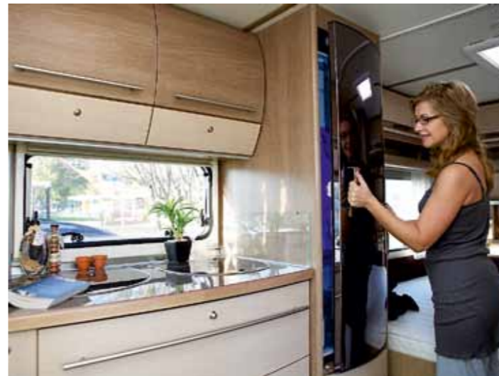
UTTAGBART. Slim Tower-kyl med frysfack som går att lyfta ur, hör till vagnens standard. Kylens front är dessutom spegelvänlig.

Och det här är verkligen ingen barnfamiljevagn. Nej, Fendt Tendenza är en vagn för vuxna som vill ha ett bekvämt campingliv och inte har behov av att göra storkök i husvagns-