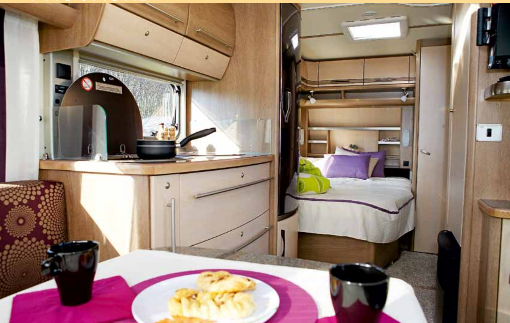
HELA HÄRLIGHETEN. Tendenza har en modern inredning och planlösningen är optimal för en vagn med invändig längd på 500 cm.

en modiefärg 2010, men faktum är att sittgruppen i stormönstrat lila och brons är så elegant att den nog får kategoriseras som en evergreen. När vi sedan blickar