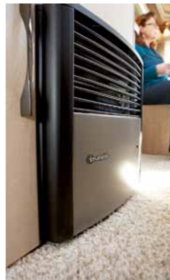
ELPANNA. Värmen i vagnen sköts av en Trumatic S3002.